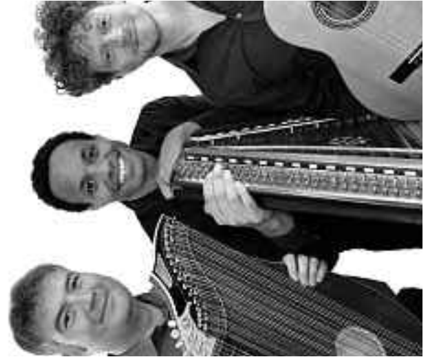
© Norbert Riggemann - Änderungen vorbehalten