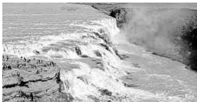
„Skogafoss“ - Wasserfall im Süden Islands - Fallhöhe 60 Meter

Wir laden Sie herzlich ein zu diesem besonderen Vortrag am Dienstag, den 03. April 2014 um 19.30 Uhr ins Vereinshaus „Alte Schule“ , Hauptstraße 26, in 89284 Pfaffenhofen, in den Vortragsraum der AWO im 1. Stock. Der Eintritt zu dieser Veranstaltung ist frei.