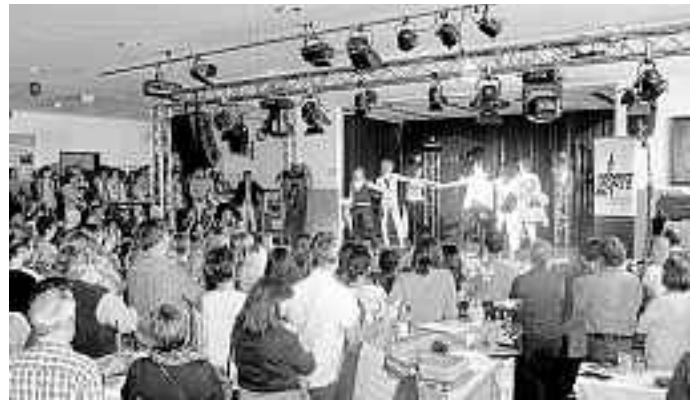
Auf der Showbühne geht die Post ab.