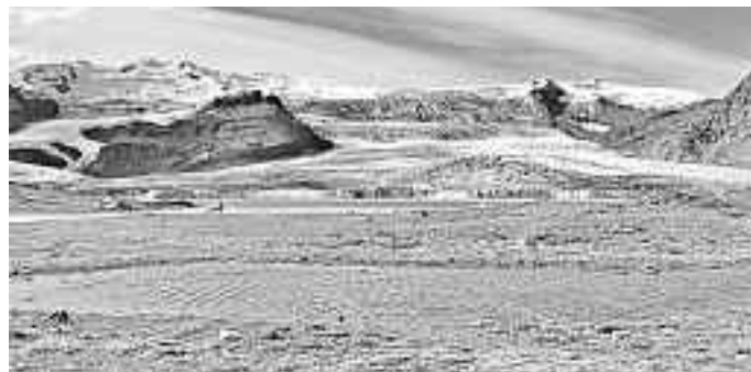
„Vatnajökull“ - Europas größter Gletscher auf Island - 8100 km 2 Fläche - Foto: Wolfgang Kiesecker