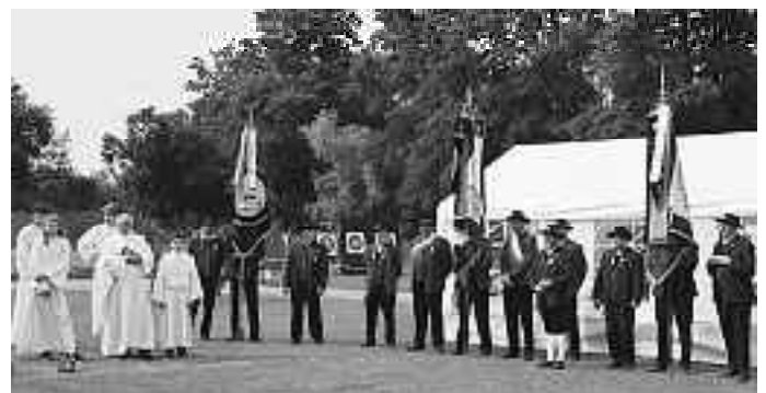
Einweihung Bogenschießplatz am 24.06.2018