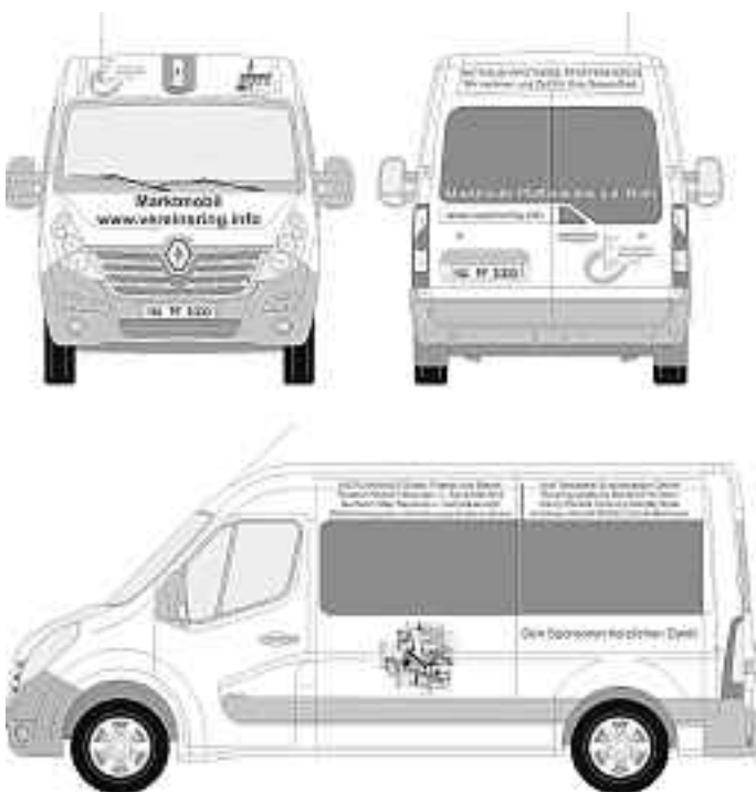
Das neue Marktmobil ab August. Vielen Dank den Sponsoren!