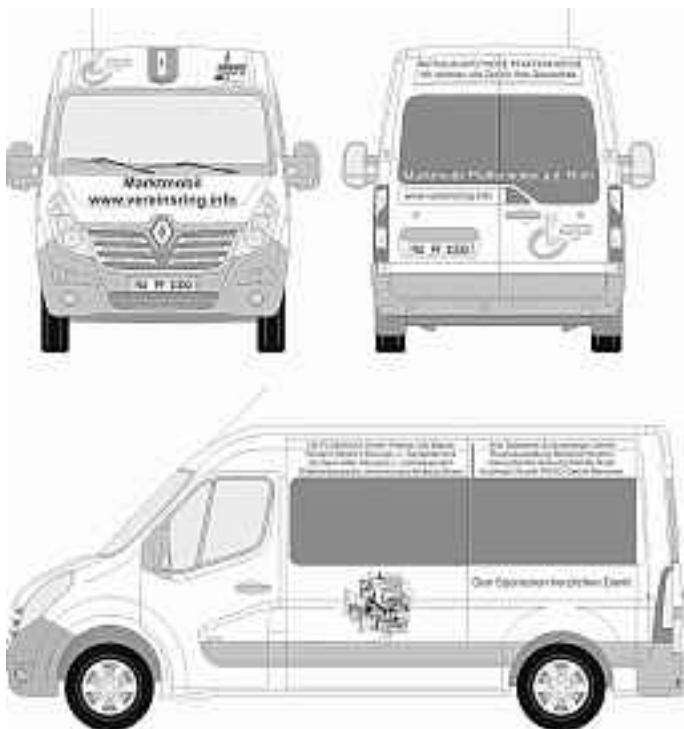
Das neue Marktmobil ab August. Vielen Dank den Sponsoren!

Leider hat das alte Fahrzeug derzeit einen Defekt nach dem anderen. Auch kam es zu zwei Unfällen, weshalb ein weiterbetrieb mit diesem Fahrzeug nicht mehr rentabel ist. Anfang August wird das neue Marktmobil in Dienst gestellt werden. Wir haben einen Renault Master L2H2 bestellt. Das Fahrzeug verfügt zusätzlich über ein automatisches Getriebe, Rückfahrkamera, Navigationssystem und Trittsstufe an der hinteren Türe. Es hat einen ca. 30 cm längeren Kofferraum und ist insgesamt knapp 20 cm breiter als das Bisherige. Wir bedanken uns bei allen Sponsoren die Unterstützung: Aichinger Finanz, Aral Tankstelle Schlumberger GmbH, Autohaus Rudolf ROGG GmbH Illertissen, Bäckerei Stetter, BATS-Feuerschutz, Endres Immobilien, Georg Reitzle Heizung-Sanitär-Solar, Gewerbeverband Pfaffenhofen, Gold Elektrotechnik, Hörgeräte Bösch, HS PLANHAUS GmbH, Konrad Jahn Bonnfinanz Pfaffenhofen, Mosterei u. Getränkemarkt Gerhard Hiller, Naturheilpraxis Christine Fliegel, NewTec GmbH, Rathaus Apotheke, Raumausstattung Manfred Hommel, Richard Reitzle Heizungs- u. Sanitärtechnik, Schlossbrauerei Autenried, VR-Bank in Pfaffenhofen, Württembergische Versicherung Andreas Boser