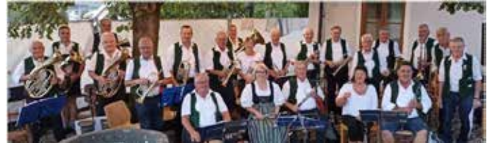
Alte Hasen 2023