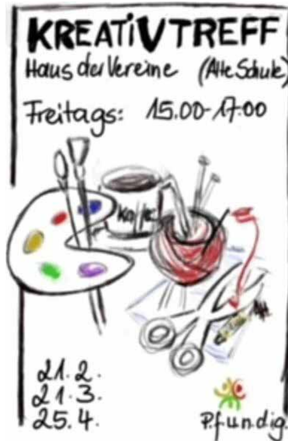
Die ersten 3 Termine 2025

Auch der Kreativ-Treff hat sich etabliert und immer mehr kreative Menschen treffen sich zum gemeinsamen Malen, Basteln oder anderen künstlerischen Aktivitäten. Nach einer kleinen Pause im Januar ging es am 21. Februar 2025 wieder los. Genau 4 Wochen später ist der nächste Treff angesagt: Freitag, 21.03.2025.